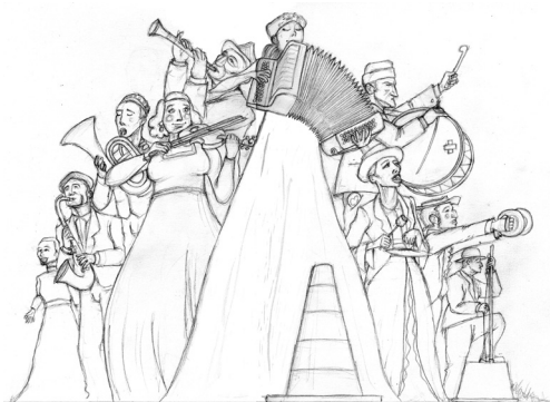
Cabaret ! dernière le 3 août au festival Remise à Neuf

Depuis 20 ans, notre tour de chants débraillés sillonne vos routes et vos tympanes. Nous lui offrons les 20 ans du Festival Remise à Neuf à St Jean de la Blaquièrre (34) le 3 août, comme bouquet final. Un double anniversaire !