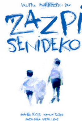
Zazpi , en tournée au Pays Basque