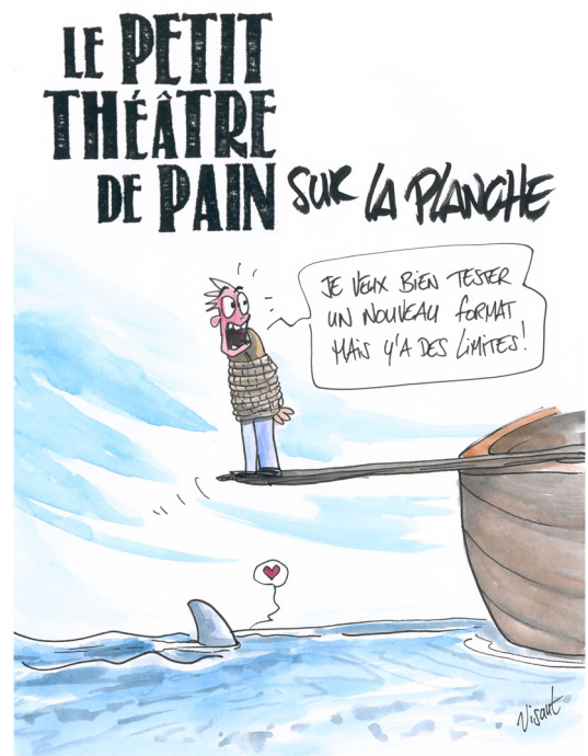
Illustration : Visant https://visant.fr